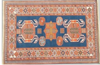
Bəhmənli (Talış) xalçası