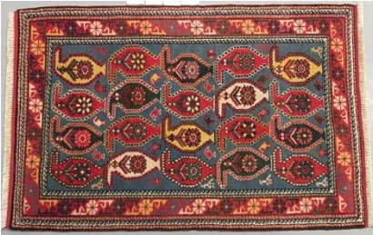
Butalı Qarabağ xalçası